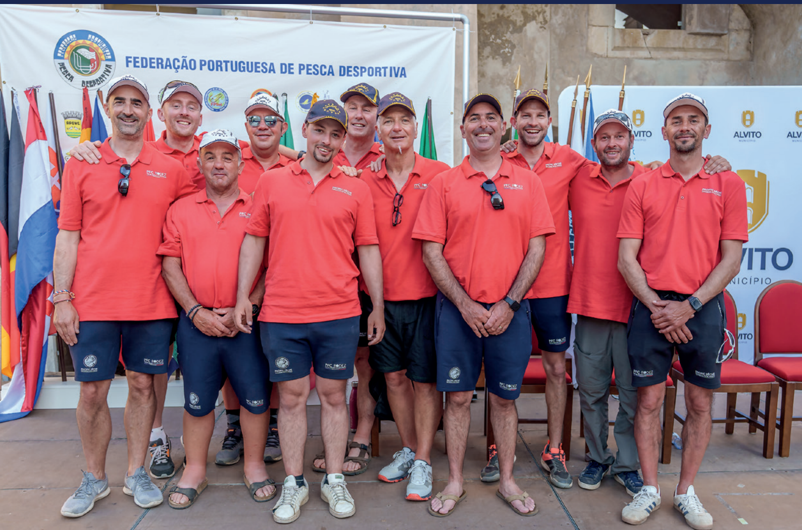
L'équipe du PFC Rodez lors de la cérémonie d'ouverture du championnat du monde des clubs 2024 au Portugal.