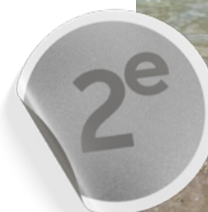
Owen Morales, second de la coupe de France des moins de 20 ans 2025.