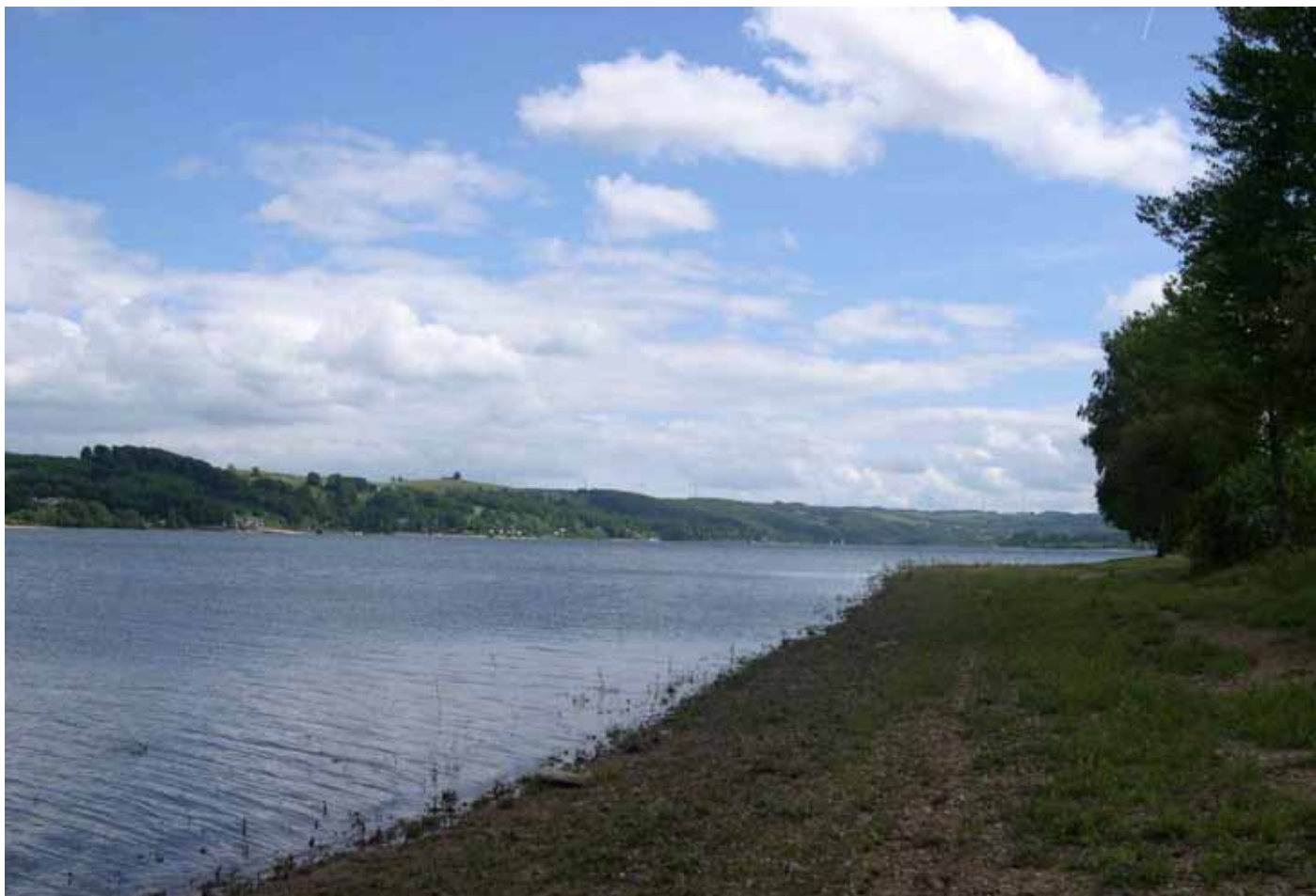
Secteur de pêche A au camping du caussanel