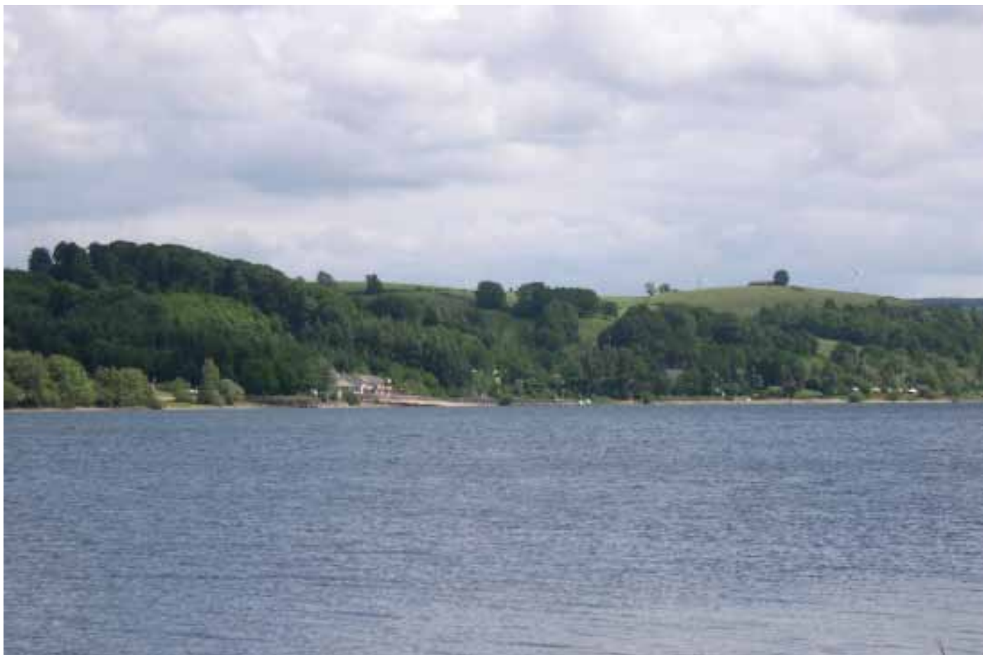
Secteur de pêche B sur la berge en face